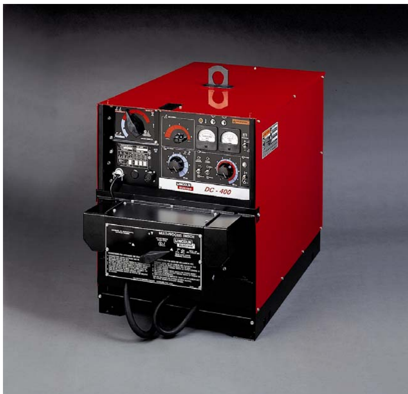
DC-400 изображен с дополнительно установленным процесс-переключателем K804-1

Источник питания DC-400 - это универсальный сварочный выпрямитель с тиристорным управлением, обеспечивающий как жесткие, так и падающие внешние вольтамперные характеристики. Аппарат предназначен для полуавтоматической сварки сплошной и порошковой проволокой и автоматической сварки под флюсом. Дополнительно DC-400 может использоваться для сварки штучным электродом, сварки неплавящимся электродом в инертных газах, а так же для воздушной строжки угольными электродами диаметром до 5/16" (8 мм). Источник питания оборудован единственным потенциометром плавной регулировки выходной мощности во всем ее диапазоне.